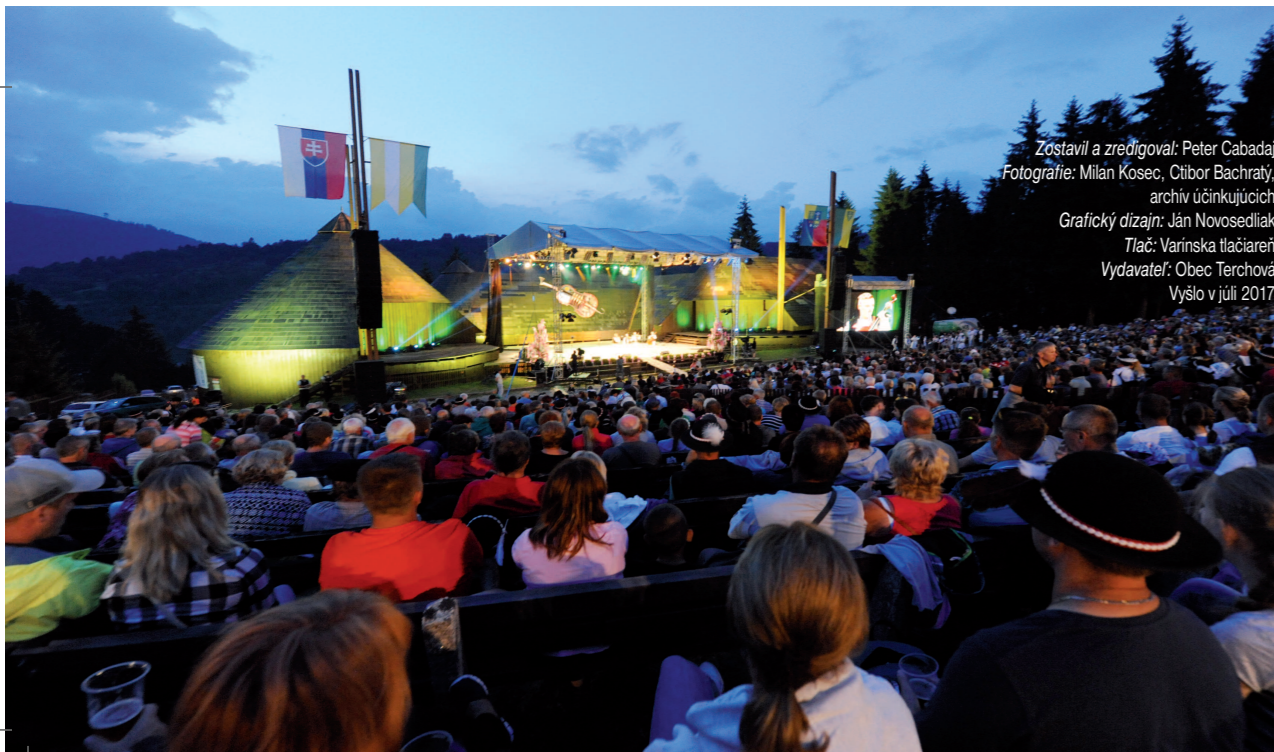
Zostavil a zredigoval: Peter Cabada Grafický dizajn: Ján Novosedliak Tlač: Varínska tlačiareň Vydavateľ: Obec Terchová Vyšlo v júli 2017.